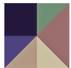
kolor indywidualny Możliwość barwienia betonu w masie, wymaga indywidualnej konsultacji.